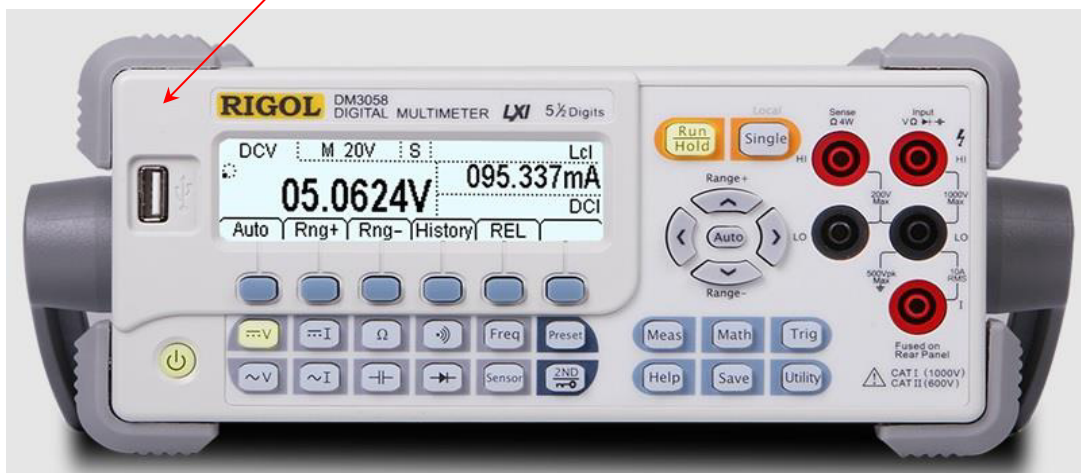
Рисунок 1 – Передняя панель Rigol DM3058